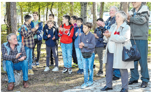
U programu su sudjelovali hreljinski i opatijski osnovci

HRELJIN ► Savez antifašističkih boraca i antifašista Primorsko-goranske županije i Udruga antifašističkih boraca i antifašista Grada Bakra i ove su godine organizirali komemoraciju kod spomen-kosturnice na groblju Hreljin, u povodu godišnjice pogibije boraca 2. brigade 13. primorsko-goranske udarne divizije. Bila je to prigoda za sjećanje na ratne dane 6. i 7. listopada 1943. godine, kada je tijekom njemačke ofenzive na području Hreljina stradalo 108 antifašista, većinom s područja Gorskog kotara, Primorja, otoka i Grobnišćine. Uz polaganje vijenaca i paljenje svijeća, održan je i prigodan program u kojem su sudjelovali učenici osnovnih škola Hreljin i Rikarda Katalinića Jere-tova Opatija, s recitacijama i pjesmama posvećenim domovini i domoljublju, a učenici su ujedno pročitali imena svih stradalih prije 79 godina. Komemoracija je i ove godine privukla predstavnike velikog broja antifašističkih udruga s područja PGŽ-a.