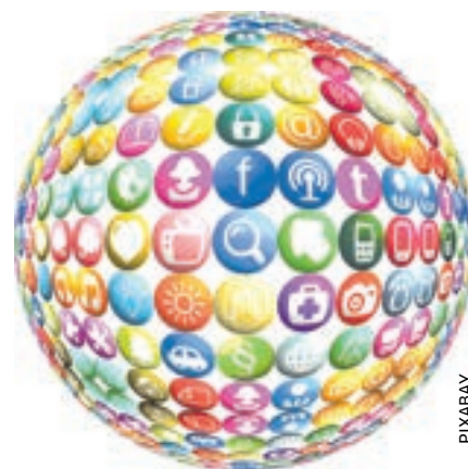
EDUKACIJA, NE REPRESIJA

Medijsko opismenjavanje učinkovitije od zabrane društvenih mreža mladima