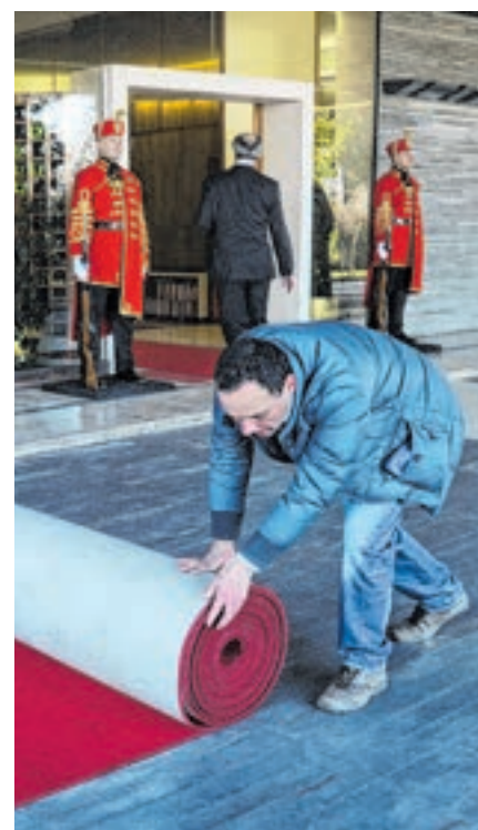
BITKA ZA PANTOVČAK

Sustav bi bolje funkcionirao kada bismo predsjednika birali kao suce Ustavnog suda?