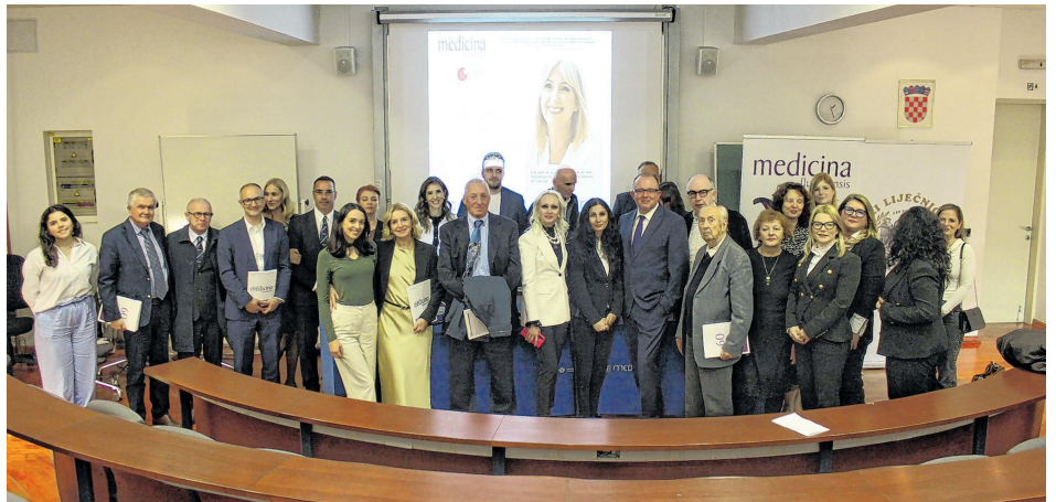
Sa svečane promocije prigodnog dopunskog izdanja

- Ključnu ulogu u poticanju usvajanja vještina