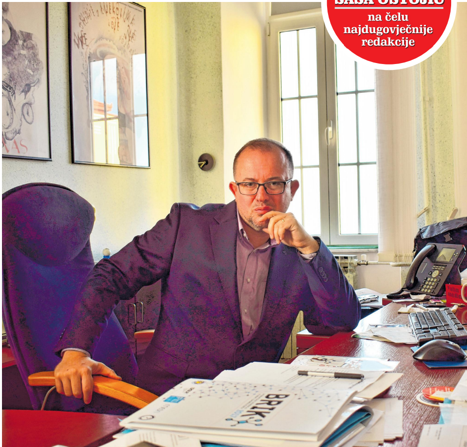
Medicina Fluminensis nadilazi ograničenja formata, trendova i pritisaka

- Postupci pisanja i recenziranja prilagođeni su smjernicama Međunarodnog odbora urednika medicinskih