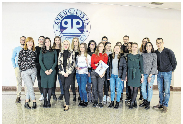
Studentska sekcija glasila

akadenskog pisanja i objavljivanja prema međunarodnim standardima ima Studentska sekcija Medicine Fluminensis, osnovana 2017. godine. Osnovni je cilj bio promicanje studentske znanstvene aktivnosti na Medicinskom fakultetu u Rijeci, što se proširilo i na druge srodne fakultete te međunarodno razinu. Pod vodstvom prof. dr. Nine Perez, pomoćne urednice glasila za studentsku sekciju, kao i sudjelovanjem 20-tak